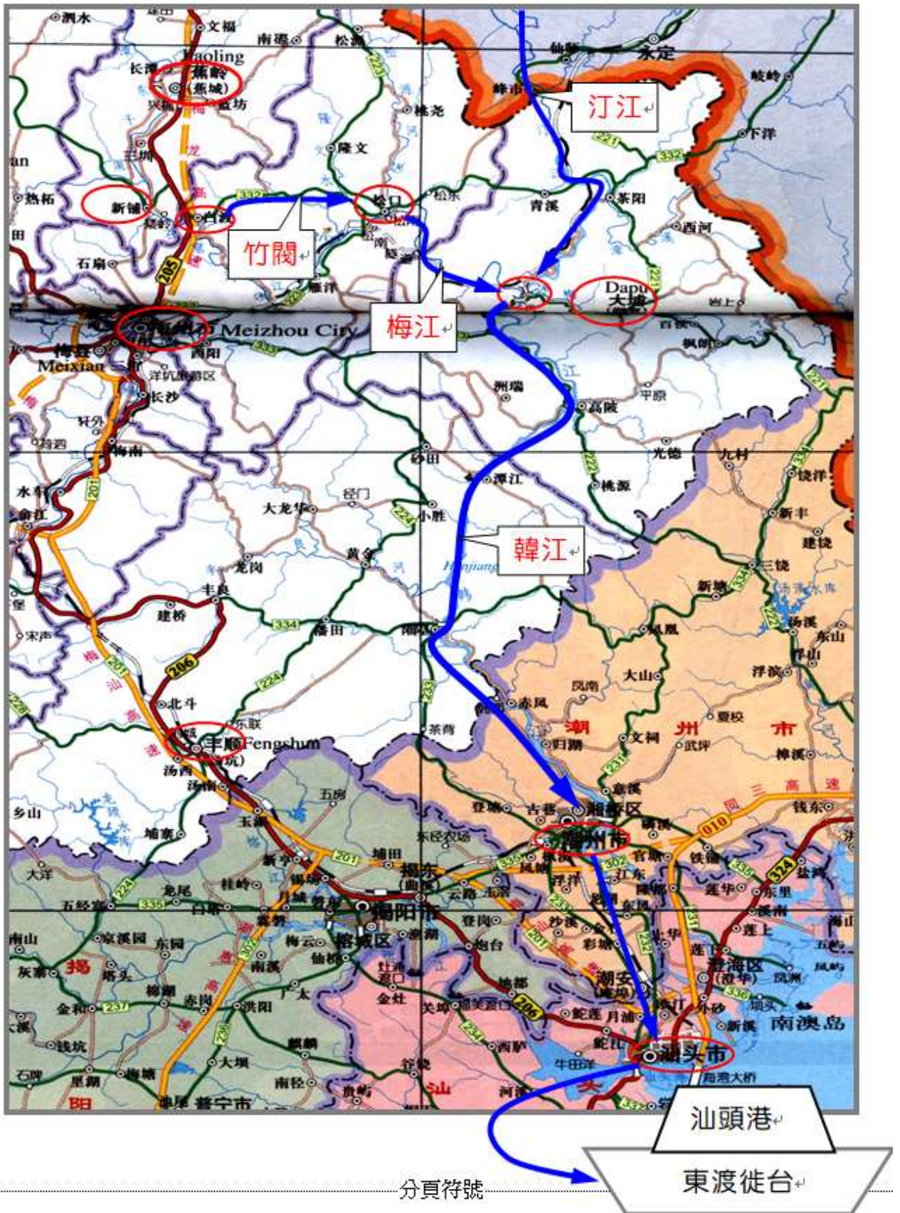
史地 9.61. 蕉嶺曾氏從汕頭港東渡台灣線路