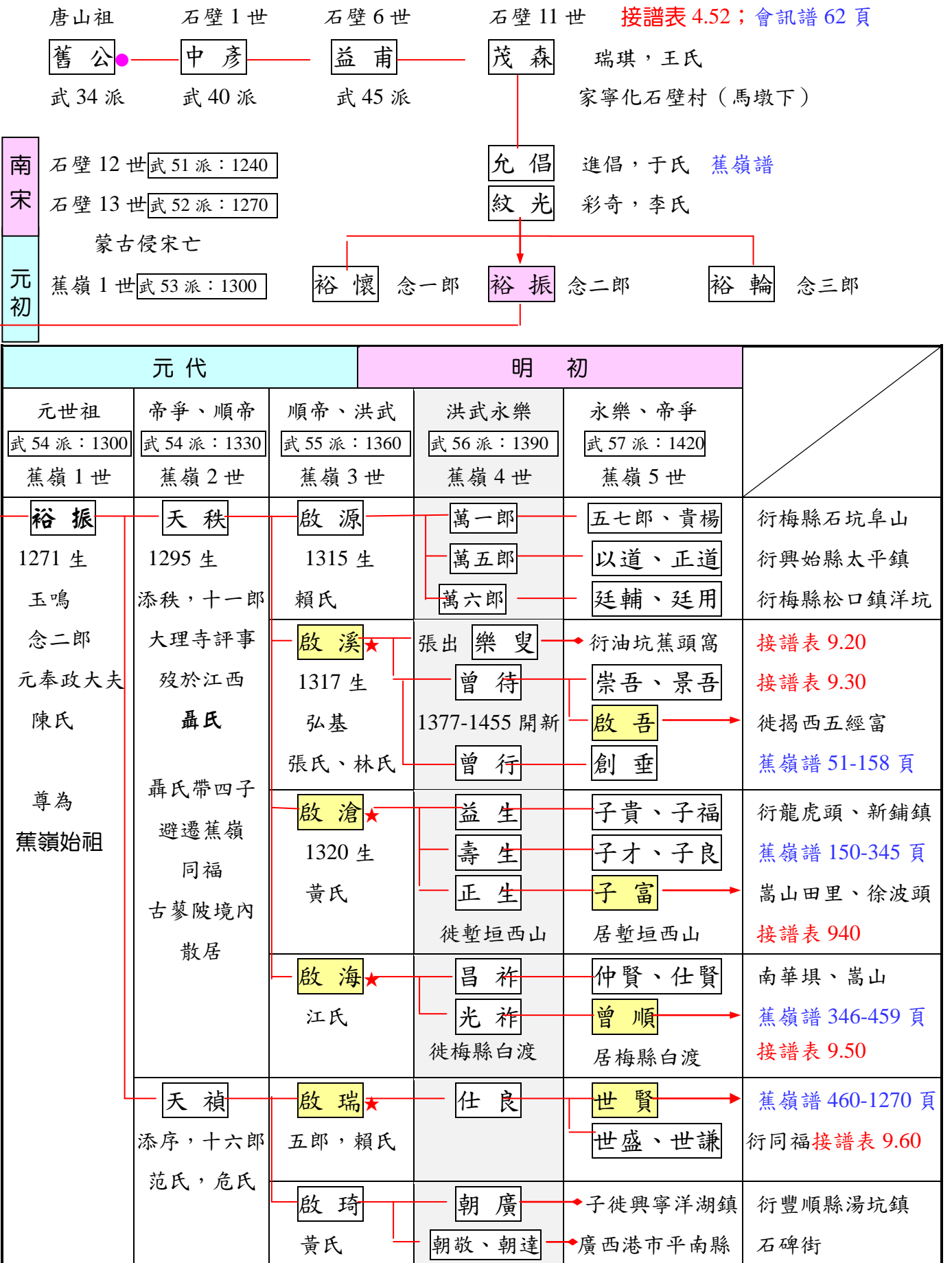
譜表 9.10 徙梅州蕉嶺曾裕振支脈分行