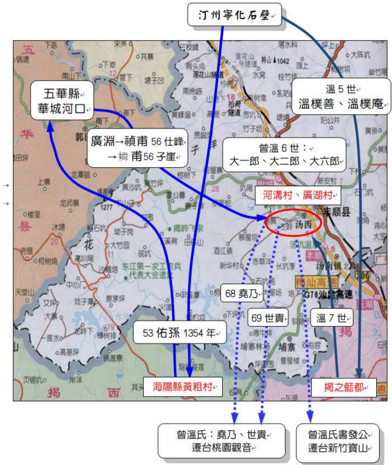
史地 8.41 豐順縣(河溝村、廣湖村)曾溫氏→徙台線路