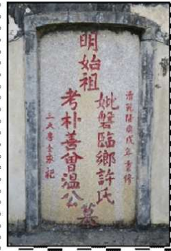
曾溫樸善公及夫人許氏墓 (豐順湯南鎮)