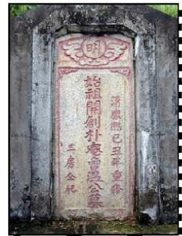
曾溫樸庵公墓 (豐順湯南鎮)