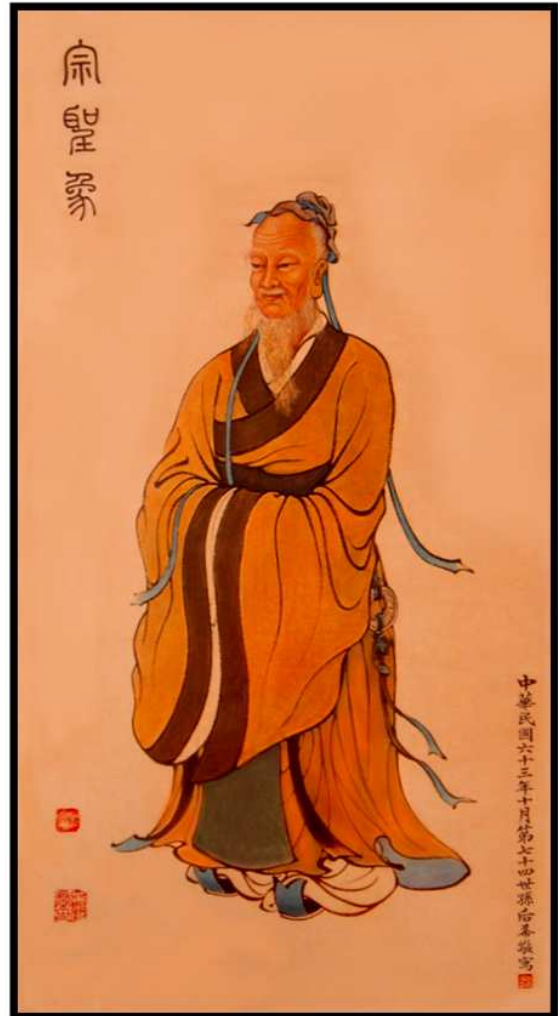
宗聖公 武城 1 派：前 470 曾子 公元（前 505～435）年

曾參乃被尊稱為宗聖曾子。明嘉靖十二年（公元 1533 年），史部左侍郎，前翰林學士顧鼎臣奏，聖裁准照依孔、顏、孟事例，訪求曾氏子孫相應者一人，世襲翰林院五經博士，代代承襲，俾守曾子廟墓，以主祀事。據此，武城曾氏族譜敕封為宗聖族譜，以曾子為「武城開派始祖」。