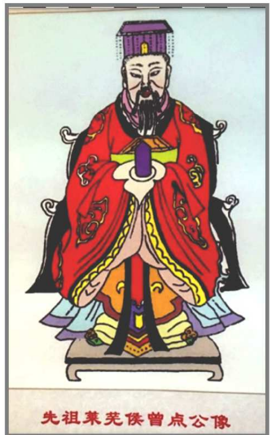
先祖萊蕪侯曾点公像

這時魯國政局發生重大變化，魯昭公時(公元前 541-510 年)，三桓將魯國王室的土地財產、軍隊及人口瓜分，再由三桓進貢供養魯國君主。曾點乃從早先的貴族家庭，變為一介平民百姓，需靠自己從事農耕種植生產，生活相當辛苦。