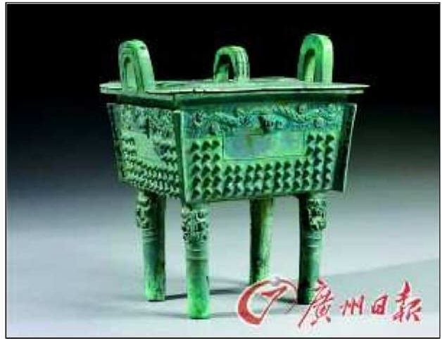
曾侯墓地出土青銅器

戰後噩國族人被分裂為三：一部分南逃成為後來楚國的東鄂土人，一部分西遷成為申國的私屬，還有一部分噩人連同部分國土被方城曾國兼併。這支南逃成為噩族人，後來落腳在漢江下游與長江會流之地，成為楚國東方的鄂國。